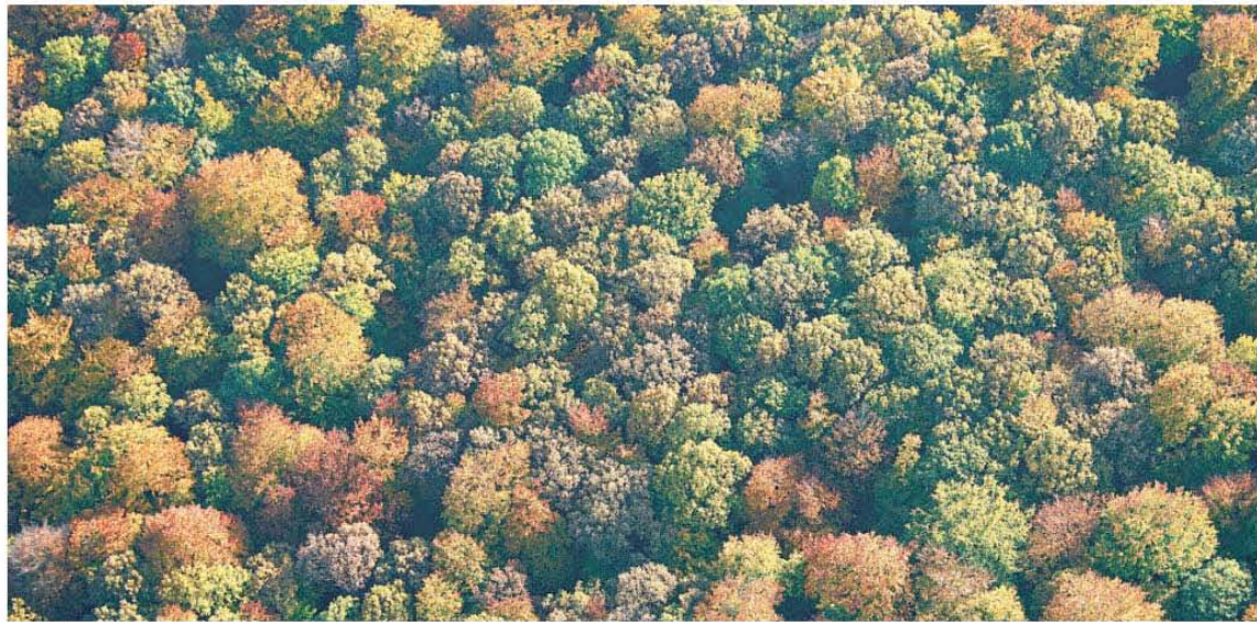
Im Herbst zeigt sich die Artenvielfalt im nördlichen Steigerwald im farbenfrohen Mosaik mit allen Abstufungen vom späten Grün bis zum Gelb.