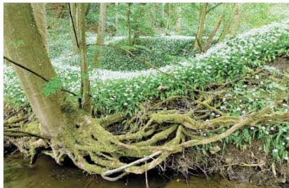
Bärlauchblüte im Naturschutzgebiet Spitalsgrund am Oberlauf der Volkach.

Passend zum Ort durfte an diesem Tag auch geistlicher Rat nicht fehlen: Er kam von dem Münsterschwarzacher Pater Franziskus Büll, dem Vorsitzenden des Forschungskreises Ebrach. Büll lobte die Buchenwälder um Ebrach als leuchtendes Beispiel klösterlicher Waldkultur, beklagte aber zugleich einen in unserem Land „empfindlichen Rückgang der Vogelwelt“. Den Befürwortern eines Nationalparks riet der Benediktiner und Biologe, eine solche Entscheidung nicht über die Köpfe der betroffenen Menschen hinweg zu treffen und die Sorgen der Menschen zu hören. Den Gegnern empfahl er, sich nicht verängstigt gegen die Idee zu sperren, sondern ihre Chancen zu sehen. Das Buch „Fränkisches Naturerbe“ könne, so der Pater, eine gute Grundlage bieten, um mit beherzter Tatkraft eine gute Entscheidung zu treffen.