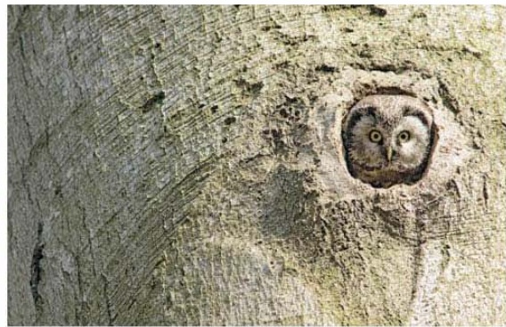
Ein Rauhußkauz hat eine Höhle des Schwarzspechts bezogen.