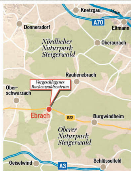
Oberer und nördlicher Steigerwald

Auch beim Bamberger Landrat stößt der Vorschlag der Naturschützer auf Zustimmung. „Ich bin sehr angetan von dem Projekt. Ein solches Haus wäre für Ebrach eine große Bereicherung“, erklärte Günther Denzler. Wie er sagte, befindet man sich bereits auf der Suche nach einer Immobilie. Bund Naturschutz und Landesbund für Vogelschutz sind nicht die einzigen, die derzeit an einem Buchenwaldzentrum arbeiten. Wie gestern zu erfahren war, hat Staatssekretär Gerhard Eck (CSU), Vorsitzender des einen Nationalpark vehement ablehnenden Vereins „Unser Steigerwald“, Mitte Oktober zu einer Veranstaltung im Landkreis Schweinfurt eingeladen. Dabei soll es um ein „Bucheninfozentrum“ in Unterfranken gehen. Offizielle Auskünfte dazu gab Eck aber nicht.