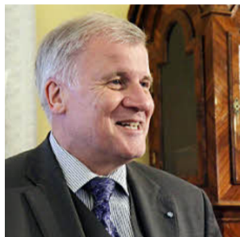
Seehofer verspricht in Handthal einen Baumwipfelpfad mit Millionen aus den Erlösen der Staatsforsten zu unterstützen.

Auf der Bamberger Seite hat man das Ziel, Weltnaturerbe oder Nationalpark zu werden, trotz des Neins von Seehofer noch nicht aufgegeben. Der Bamberger Landrat Günther Denzler (CSU) engagiert sich mit Wissenschaftlern und Naturschützern im Verein „Buchen – Frankens Naturerbe“. Und die Bamberger Grünen wollen den Nationalpark zum Thema für den Landtagswahlkampf 2013 machen. MW