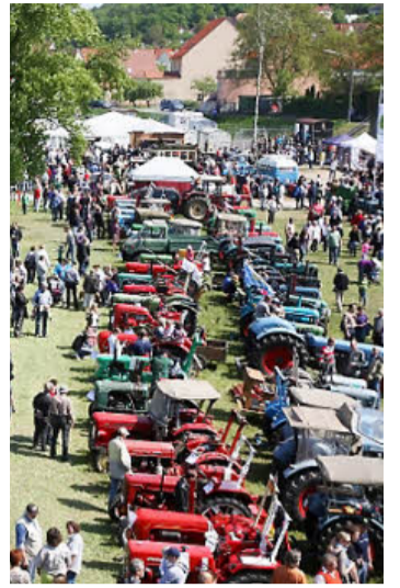
Viereth feierte ein ganzes Jahr lang sein 1100-jähriges Bestehen mit einem bunten Reigen an Jubiläumsveranstaltungen. Herausragend war dabei auch das Oldtimertreffen am 1. Mai mit über 400 historischen Fahrzeugen.