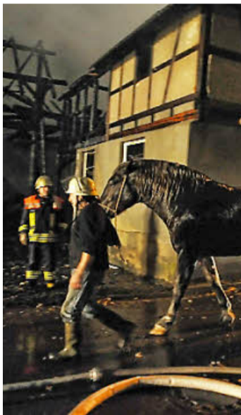
Wie durch ein Wunder überlebten alle 100 Tiere, als in den frühen Morgenstunden des 17. November in Zapfendorf ein Bauernhof abbrannte. Die Einsatzkräfte waren besonders bei den zwei Kaltbluthengsten Max und Moritz gefordert. Über Stunden hinweg waren sie von Flammen umgeben und wukden doch lebendig aus dem schwelenden Stall geholt.