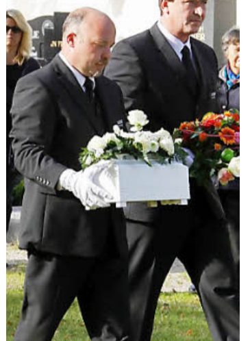
Eine Mädchenleiche entdeckte am 23. Oktober eine Spaziergängerin in einem Gebüsch bei Walsdorf. Mehrere Tage lang hatte der tote Säugling bereits dort gelegen. Zunächst war nicht bekannt, wer die Mutter des Kindes ist. Unter großer Anteilnahme wurde das Kind auf dem Walsdorfer Friedhof beigesetzt (Bild). Zwei Monate nach dem Tod des Kindes, am 14. Dezember, nahm die Polizei nahe Stuttgart die 28 Jahre alte Mutter fest.