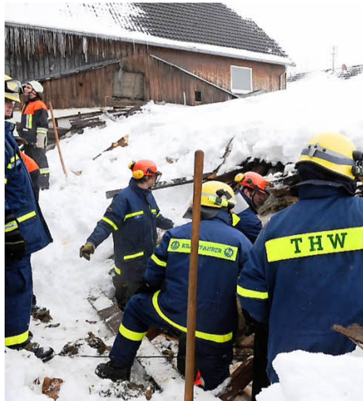
In Herzogenreuth brach am Morgen des 2. Januars ein Stalldach unter der Schneelast zusammen und begrub 60 Milchkühe unter sich. In einer spektakulären Gemeinschaftsaktion konnten alle Tiere aus den Trümmern gerettet werden.