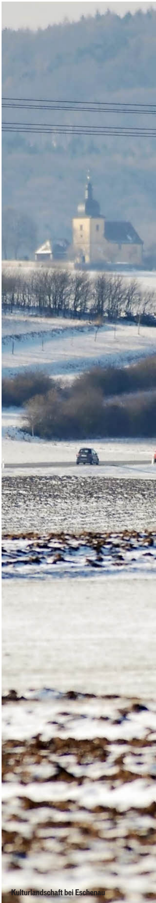
Kulturlandschaft bei Eschenau

Absolut unglaubwürdig ist aber, wie sehr der Bund Naturschutz in der Steigerwald-Diskussion auf diese wirtschaftliche Karte gesetzt hat, nicht auf den Naturschutz. Der Steigerwald wird nicht besser, wenn er offensiv für den Tourismus erschlossen wird. Und für die Menschen im Steigerwald nicht lebenswerter. Die Naturschützer haben mit dieser Taktik ihrem eigenen Traum einen Bärendienst erwiesen. Bernhard Grzimek, Vater der Nationalpark-Idee, wäre nie auf die Idee gekommen, erst die wirtschaftlichen Effekte zu sehen und dann den Schutz der Natur. Hätte er so gedacht, dann wäre die Serengeti in Ostafrika heute ein Öko-Disneyland. Hier ist es gelungen, die Natur nachhaltig zu schützen und auf diesem Weg für den Tourismus interessant zu machen. So herum, langfristig und nachhaltig, so wie man es auch im Wald tut. Der Bund Naturschutz wollte im Steigerwald beides, und zwar sofort. Und steht jetzt mit leeren Händen da – Blamage des Jahres.