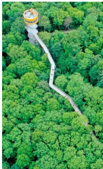
Über eine Million Besucher: Wipelpfad im Hainich.

Die zu erwartenden Millionenkosten für ein solches Projekt können nicht schrecken. Im Nationalpark Bayerischer Wald hat der 2009 eröffnete Pfad am Lusen seine Kosten von 3,2 Millionen Euro bereits im zweiten Jahr wieder eingespielt. 800 000 Besucher kamen bis heute, um im 44 Meter hohen Baumturm nach oben zu klettern. Ein Segen für den Nationalpark, sagt Rainer Pöhlmann: Allein die zusätzlich eingenommenen Parkgebühren belaufen sich auf 100 000 Euro. Eine ähnliche Erfolgsgeschichte schreibt auch der Nationalpark Hainich in Thüringen, dessen Baumwip-