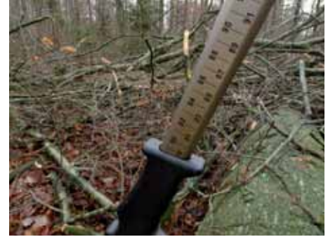
Abb. 12a: Dickemessung des Stamms

die Gerüchteküche kräftig an zu brodeln. Bei der Diskussion um den 3. Bayerischen Nationalpark wurden sämtliche Gerüchte vom Tisch gefegt. Die Bevölkerung im Steigerwald wurde aber von der Staatsregierung bis zum heutigen Tag nie über die Chancen und Auswirkungen eines Nationalparks aufgeklärt. Sie wurde auch nie in eine Diskussion auf Faktenbasis einbezogen, wie das in anderen Regionen umgesetzt wurde. Der Grund liegt wohl darin, dass der Hauptkämpfer gegen den Nationalpark in den eigenen Reihen im Landtag sitzt.