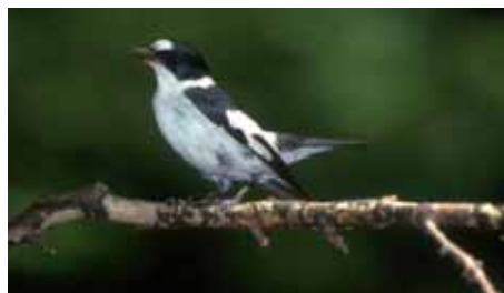
Abb. 6: Halsbandschnäpper, der Elegante im feierlich lackschwarzen und strahlendweißen Federkleid. Für einen Nationalpark Steigerwald könnte er zur Vorzeigart werden, kommt er doch in keinem der bestehenden deutschen Großschutzgebiete vor.

In bundesweiten Studien wird der Nordsteigerwald seit Jahrzehnten als hervorragend geeignet für ein großflächiges nutzungsfreies Waldschutzgebiet eingestuft. Er ist weitgehend frei von Siedlungen und öffentlichen Verkehrsanlagen. Durchgehend gab es hier alte Laubbäume, sodass deren Bewohner noch vorhanden sind, anders als in nahezu allen übrigen bayerischen Waldgebieten. Was ihm seinen Vorsprung vor dem zweitbesten bayerischen Waldgebiet, dem Hochspessart, verschafft, ist unter anderem das kleinflächige vielfältige Mosaik aus ganz unterschiedlichen natürlichen Waldlebensräumen. Aufgrund der abwechslungsreichen Keuper-Geologie finden wir im Steiger-