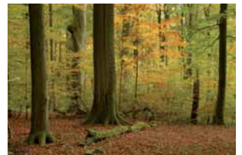
Abb. 5: Ebracher Buchen-Dom mit allen Strukturmerkmalen eines Urwalds.

Ein Drittel aller europäischen waldbewohnenden Arten ist auf uralte Bäume und reichlich Totholz angewiesen, denn so sahen unsere ursprünglichen Wälder aus. Erst ab einem Alter von ca. 180 Jahren werden Buchenwälder interessant für viele Arten: Die Borke wird rissig, Äste brechen ab und Mulm- und Faulhöhlen entstehen. Holzpilze und Insekten siedeln sich an und im modrigen Holz bauen Spechte ihre Höhlen. Baumhöhlen sind ein begehrter Wohnraum, hier ziehen Vögel wie Hohлтаube und Raufußkauz, aber auch Kleinsäuger wie Fledermäuse und Bilche ihre Jungen groß. Bricht ein Baum zusammen, besiedeln unzählige Lebewesen das Totholz und zehren es auf – oft werden sie dabei selbst gefressen. Zurück bleibt am Schluss fruchtbarer Humus, der den Waldboden düngt. Viele heimische Arten, die ausschließlich in alten Wäldern vorkommen, sind heute extrem selten geworden oder ausgestorben. Der Grund liegt auf der Hand: ihr Lebensraum ist enorm geschrumpft (Abb. 5).