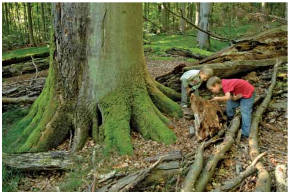
Abb. 1: Nicht nur Wissenschaftler fasziniert die Lebensfülle im modrigen Kronenholz dieser gewaltigen Buchenruine.

chen Lebenserwartung. Uralte dicke Bäume über 180 Jahre sind kaum noch zu finden, Totholz ist Mangelware und natürlich ablaufende Prozesse im Wald sind stark gestört. In Bayern hat die großmaschinelle Bewirtschaftung längst Einzug gehalten, im Durchschnitt ersetzt jede der tonnenschweren Holzernemaschinen 10 und mehr Waldarbeiter. Die staatlichen Wälder durchzieht ein dichtes Netz aus Rückegassen im 30m-Abstand zum Herausziehen gefällter Stämme und ausgebaute Forststraßen zu deren Abtransport. Auf 15–20 Prozent der bayerischen Staatswaldfläche wird der Waldboden durch Gewicht und Vibration der Großmaschinen irreparabel verdichtet. Das schädigt die Bodenlebewesen, das Netz der Feinwurzelsysteme und zerquetscht den Wasserspeicher – alle 30 Meter (Abb. 3). Im Vergleich zu den Regenwäldern der Tropenländer sind intakte Buchenwä-