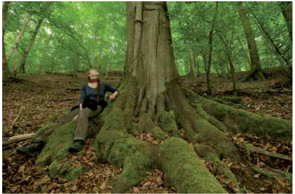
Abb. 10: Würdige dreihundertjährige Buchenmatrone, bestaunt von einer jugendlichen Bewunderin.

wurde von schweren Holzerntemaschinen zerstört. Dabei weist das Gebiet fünf Schutzgebietskategorien gleichzeitig auf: Naturpark, Landschaftsschutzgebiet, Naturschutzgebiet, FFH-Gebiet und europäisches Vogelschutzgebiet. Doch in all diesen Gebieten findet in der Regel „normale“ Forstwirtschaft statt. Viele Steigerwald-Bewohner, selbst Nationalpark-Kritiker, monieren die seit der Forstreform 2005 zunehmenden Folgen maschineller Bewirtschaftung, wie hässliche Waldbilder, zerfahrene Wanderwege und die hohe Zahl der entnommenen Altbäume. Dies zeigt, wie wichtig ein besserer Schutzstatus ist (Abb. 8 und Abb. 9).