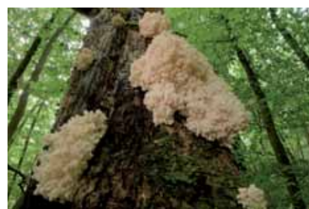
Abb. 4: Stachelbärte, die schönsten und seltensten Glanzstücke der Pilzwelt alter Buchenwälder. Der Ästige Stachelbart, Pilz des Jahres 2006, war aus den meisten heimischen Wäldern verschwunden. Er braucht starke vermodernde Buchenstämmen im fortgeschrittenen Stadium der Zersetzung.

„Buch“ oder „Buchholz“ gehen auf sie zurück. Buchenwälder waren über lange Zeiträume der Geschichte Lebensgrundlage unserer Vorfahren und Teil ihrer Identität. Buchen lieferten Brennholz und die Holzkohle für Metallschmelze und Glasherstellung. Buchekern bildeten zusammen mit Eicheln die begehrte „Waldmast“ für die Hauschweine. Buchenlaub wurde bis Mitte des vorigen Jahrhunderts als Einstreu für die Viehställe genutzt (Laubrechen). Buchenwälder sind aber weit mehr als Holz. Sie sind unser wichtigster natürlicher Lebensraum. Mehr als 11.000 Tier-, Pilz- und Pflanzenarten wurden in Buchenwäldern nachgewiesen. Rund ein Viertel davon sind „Spezialisten“, die nur hier überleben und sonst nirgends (Abb. 4).