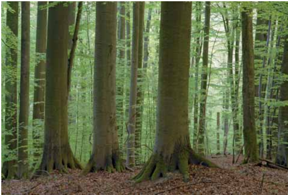
Abb. 2: Im frischen Maiengrün ein erwachsener Buchen-Altbestand, der Normalzustand im Buchen-Naturwald. In heutigen Wäldern zurückgedrängt auf kleine aus der Holznutzung entlassene Schutzgebiete.