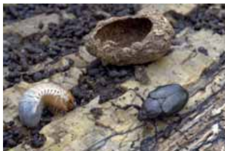
Abb. 7: Sensationsfund im Buchenwald: in zwei Naturwaldreservaten des Nordsteigerwalds konnte erstmals für Bayern auch in Buchen der Eremit nachgewiesen werden.

wald eng verzahnt verschiedenste Buchen- und Eichen-Hainbuchen-Waldgesellschaften, ergänzt um prioritäre europäische Fauna-Flora-Habitat (FFH)-Lebensraumtypen wie „Schlucht- und Hangmischwälder“. Einige kleine, seit Jahrzehnten unbewirtschaftete Naturwaldreservate besitzen enormen Reichtum an sogenannten „Altwaldarten“. Prominente Zielarten von NATURA 2000, wie Eremit, Halsbandschnäpper (Abb. 6), Mopsfledermaus oder Bachneunauge trifft man hier an. Auf 10 Hektar (ha) wurden im Naturwaldreservat Waldhaus 1.300 Pilz-, Pflanzen- und Tierarten nachgewiesen. Die meisten der in bayerischen Naturwaldreservaten entdeckten Käferarten wurden bisher im Naturwaldreservat Waldhaus bei Ebrach gefunden, stolze 314 Arten, darunter auch erstmals im Buchenwald in Bayern die Urwaldreliktart Eremit (Abb. 7).