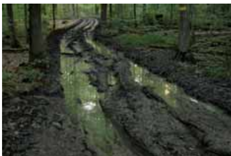
Abb. 3: Bodenzerstörung auf Holzrückegasse: in den Bayerischen Staatsforsten müssen im Abstand von nur 30 m sogenannte Rückegassen für das Ausziehen der gefällten Stämme angelegt werden. Dadurch werden 15–20 % der Waldbodenfläche zerstört.

der sehr viel stärker gefährdet. Sie gelten als eines der am meisten bedrohten Waldökosysteme dieser Erde.