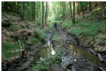
Abb. 8: Massive Schädigung eines Feuersalamander-Laichgebietes im Naturschutzgebiet Weilersbachtal im Forstbetrieb Ebrach durch Befahren des Bachbetts mit schweren Forstmaschinen.

wurde von schweren Holzerntemaschinen zerstört. Dabei weist das Gebiet fünf Schutzgebietskategorien gleichzeitig auf: Naturpark, Landschaftsschutzgebiet, Naturschutzgebiet, FFH-Gebiet und europäisches Vogelschutzgebiet. Doch in all diesen Gebieten findet in der Regel „normale“ Forstwirtschaft statt. Viele Steigerwald-Bewohner, selbst Nationalpark-Kritiker, monieren die seit der Forstreform 2005 zunehmenden Folgen maschineller Bewirtschaftung, wie hässliche Waldbilder, zerfahrene Wanderwege und die hohe Zahl der entnommenen Altbäume. Dies zeigt, wie wichtig ein besserer Schutzstatus ist (Abb. 8 und Abb. 9).