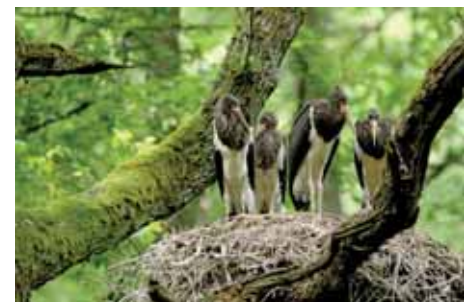
Abb. 11: Der Schwarzstorch baut seine riesigen Horste bevorzugt in alte Laubbaumkronen. Die Ungestörtheit von Waldreservaten weiß er für die Aufzucht seiner Jungvögel zu schätzen.

heit erklärt. Drei davon waren bei Voruntersuchungen schlechter eingestuft als der Nordsteigerwald, der bundesweit auf den fünftbesten Platz gelangte. Er konnte jedoch bei der Nominierung nicht berücksichtigt werden, da ihm ein entsprechendes Großschutzgebiet fehlte. 2017 wurde das Weltnaturerbe Buchenwälder (Karpatenurwälder und Alte Buchenwälder Deutschlands) mit Wäldern aus 10 europäischen Ländern vergrößert. Weitere Länder sind an einer Meldung interessiert. Die Bayerische Staatsregierung hätte hier nochmals die große Chance mit an Bord zu sein (Abb. 11).