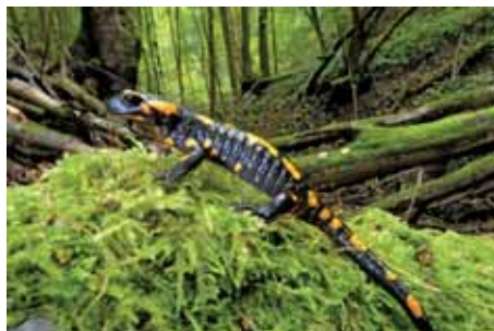
Abb. 9: An regnerischen Tagen sind Feuersalamander auch tagsüber in den Schluchtwäldern unterwegs. Zum Aufwachsen seiner lebendgeborenen Larven benötigen sie fischfreie, klare Quellbäche.