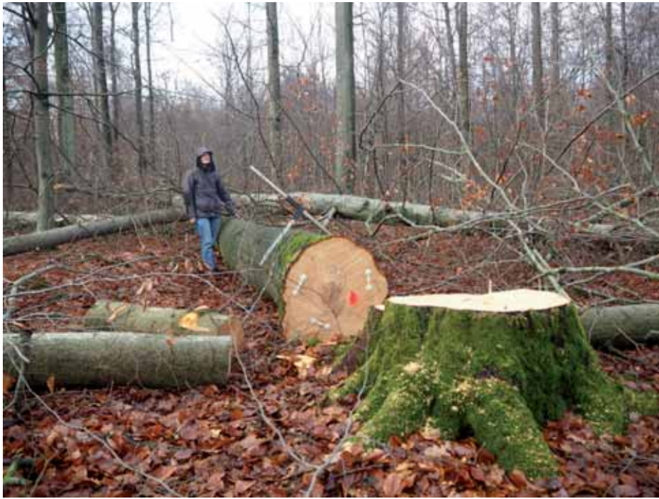
Abb. 12: Das Naturerbe liegt am Boden. Im Dezember 2018 beginnt der Forstbetrieb Ebrach im aufgehobenen Schutzgebiet „Hoher Buchener Wald“ wieder mit massivem Einschlag auch starker Buchen.