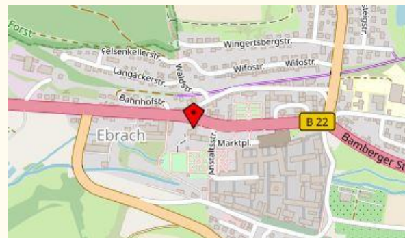
Karten erstellt aus open street maps Daten